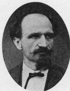
C. G. THOMSON 1824-1899