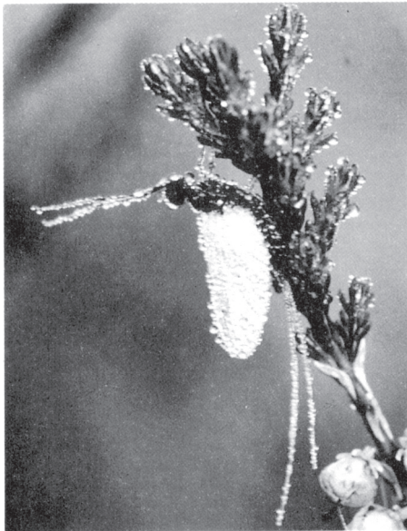
Figur 2. Liten spissgjelledøgnflue ( Leptophlebia vespertina ).

Takk til J. Brittain for verdifulle kommentarer.