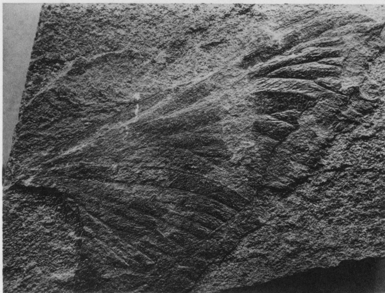
G. DEMOULIN. — Nouvelles recherches sur Patteiskya bouckaerti LAURENTIAUX.