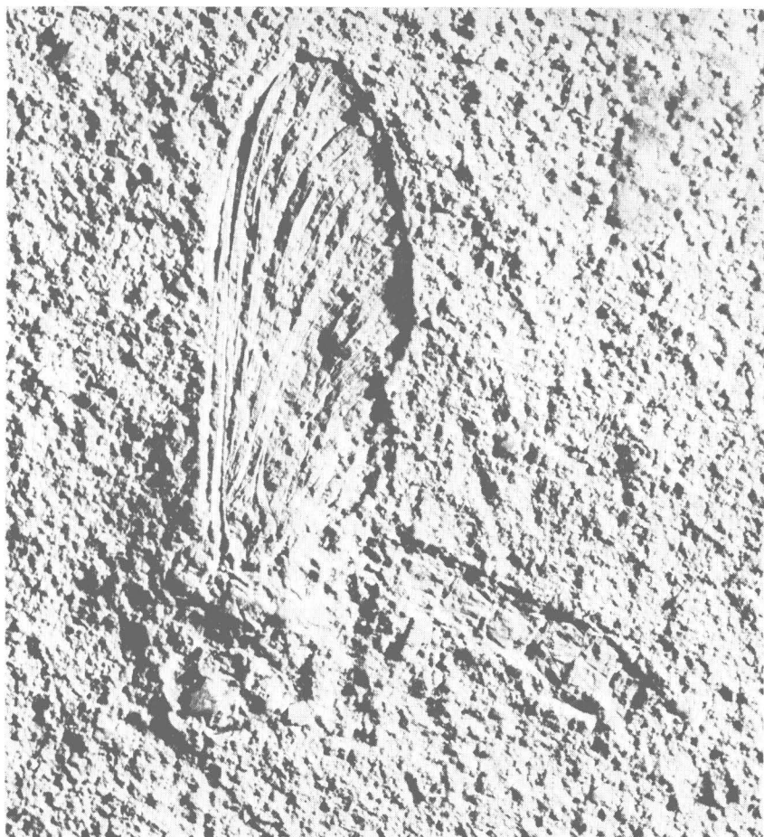
Hexagenites cellulosus (HAGEN) ♀ (Holotype de Paedephemera multinervosa (OPPENHEIM) in Bayer. Staatssamml. Pal. & hist. Geol., München). Vue générale de l'empreinte; \times 3,6 env. L'insecte se présente en vue latérale gauche.

G. DEMOULIN. — Contribution à l'étude morphologique, systématique et phylogénique des Ephéméroptères jurassiques d'Europe centrale.