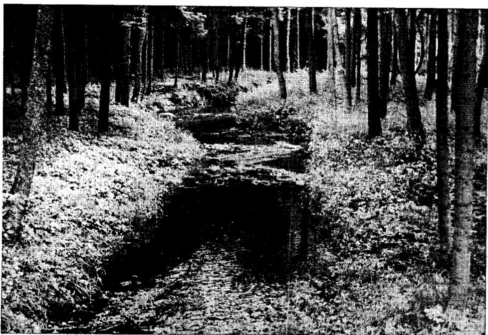
Foto 1. Závašinský potok u Bezdědovic, místo silného výskytu druhu Habrophlebia lauta . Místa s peřejemi se tu střídají s tůňkami a zátočinami s pomalu tekoucí vodou.

H. fusca žije v malých vodách pomalu tekoucích, většinou s bahnitým či bahnotopísčitým dnem bez kamenů. I tu je však třeba, aby v toku byla místa s vodou prudčeji tekoucí. Zřídka najdeme larvy tohoto druhu i ve větších, prudčeji tekou-