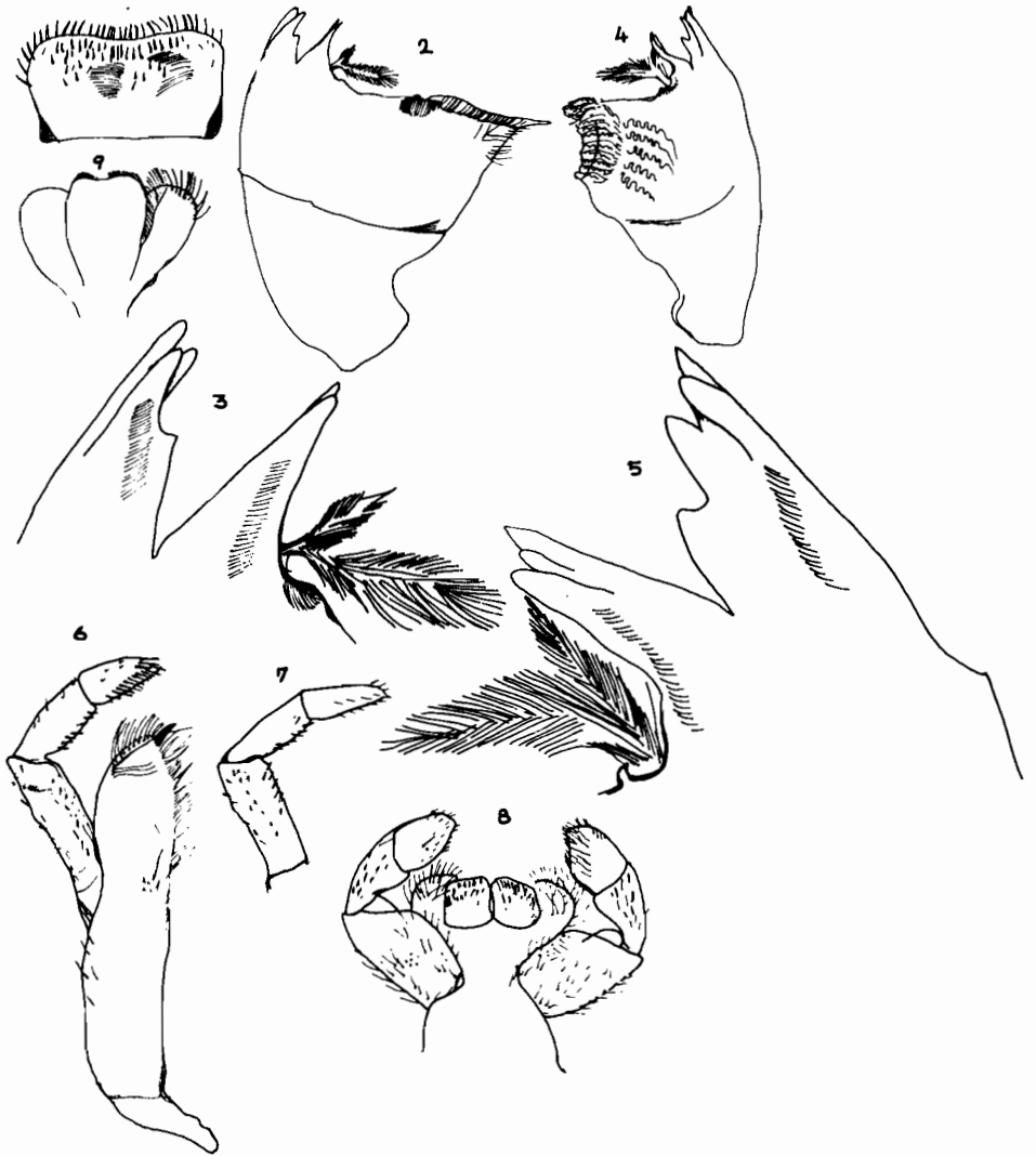
Sl. 3 — Siphonurus croaticus Ulmer. — Nimfa: 1 labrum., 2,3 desna mandibula sa kaninima i prostekom., 4,5 lijeva mandibula sa kaninima i prostekom., 6,7 maksila sa palpusom., 8 labium., 9 hypopharinx.

U istraživanim područjima Slovenije, Hrvatske i Bosne S. croaticus je konstatovan u snažnim kraškim izvorima i kraškim tekućicama, a vrlo ri-