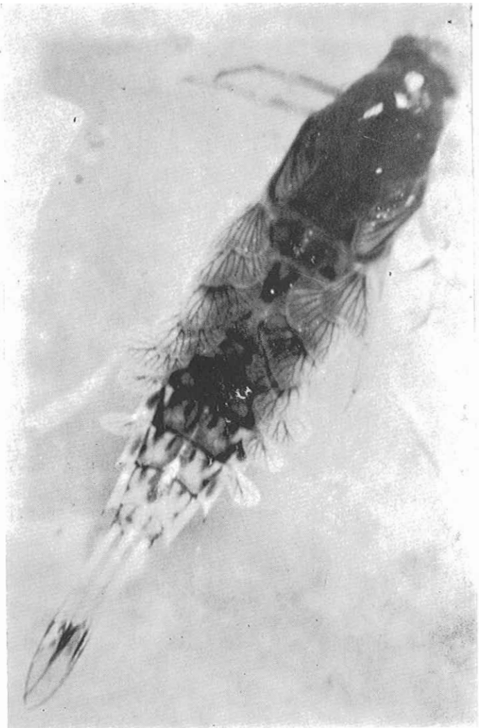
Sl. 2 — Siphonurus croaticus Ulmer: nimfa.