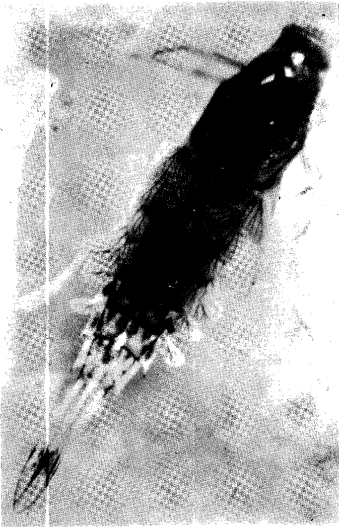
Sl. 2 — Siphonurus croaticus Ulmer: nimfa.

ne od deset članaka bez izraštaja. Labrum pravougaonog oblika sa slabo zaobljenim prednjim uglovima i plitkim udubljenjem na sredini prednje ivice. Prednja ivica i uglovi prekriveni su resastim čekinjama, a na dorzalnoj površini ima kratke, malo zakrivljene iglice. Mandibule su kratke i široke, sa dva dobro razvijena kanina. Kanini na desnoj mandibuli su subkonični i imaju po jedan uzdužni niz finih dlačica. Spoljašnji kanini se završavaju sa četiri zupca, od kojih je jedan znatno manji. Unutrašnji kanini se završavaju sa dva zupca. Desna prosteka je horizontalno postavljena, perjasta u formi slova Y, s jednim krakom jače razvijenim od drugog. Kanini na lijevoj mandibuli su široki. Spoljašnji se završavaju sa četiri zupca nejednaka po veličini i širini, a unutrašnji sa tri. I na spoljašnjim i unutrašnjim kaninima nalazi se jedan uzdužni niz finih dlačica. Lijeva prosteka je vertikalno postavljena, perjasta u formi slova Y. Maksile su tanke i izdužene. Lacine nose na distalnom rubu 11—14 dugačkih čekinja, a duž usnog ruba su obrasle čekinjama i raznim drugim nastavcima. Maksilarni palpus