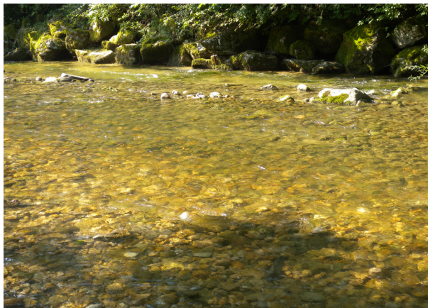
Abb. 2: Leiblach, Diezlings (27), flussabwärts, 12.08.2020.