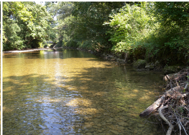
Abb. 3: Epipotamaler Abschnitt der Leiblach uh. Eisenbahnbrücke, Hörbranz (30), flussaufwärts, 13.08.2020.