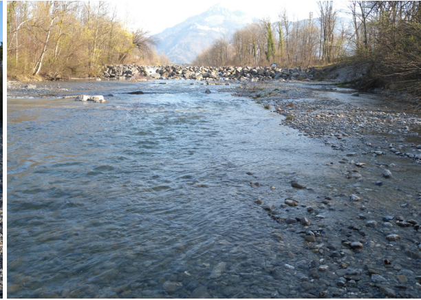
Abb. 7: Dornbirnerach, oh. Furt, Dornbirn (15), flussaufwärts, 30.03.2019.